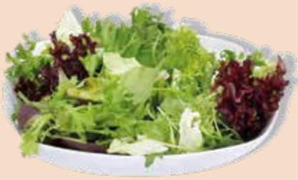
Österreichischer Salat Special Wedl 500 g