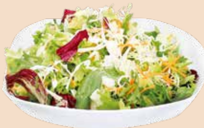
Salat Gärtner Mix 1 kg