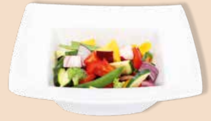
Gemüsemischung Wok Asia