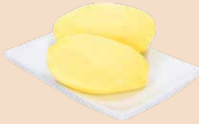
Österreichische Kartoffel roh, geschält, 5 kg