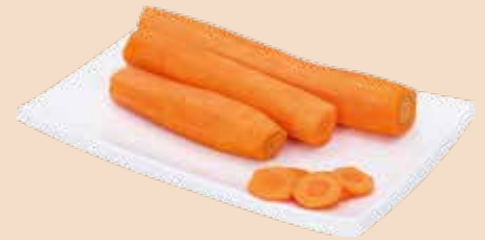
Karotten geschält, 5 kg