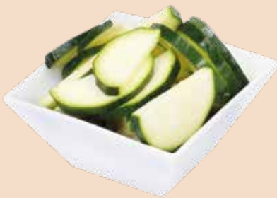
Zucchini Scheiben 3 mm, 2,5 kg