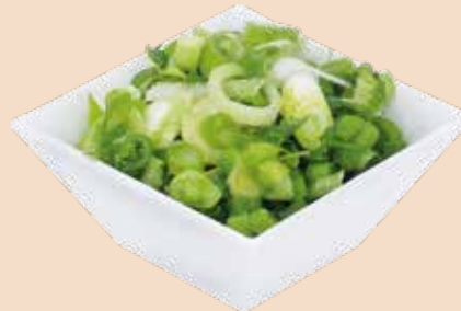
Jungzwiebel Würfel 1 kg