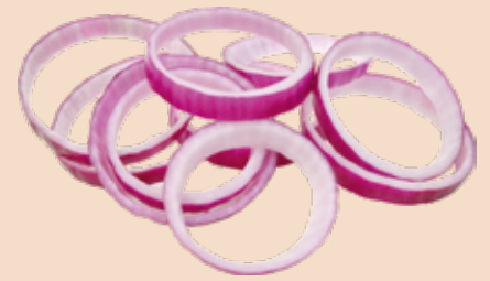
Zwiebelringe 1 kg, rot