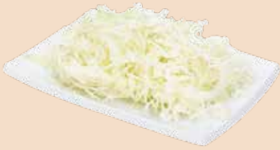
Weisskraut geschnitten, 1 kg