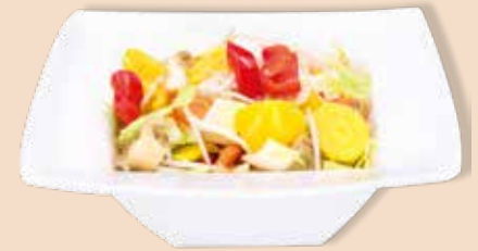
Wok Gemüse Fire 2,5 kg