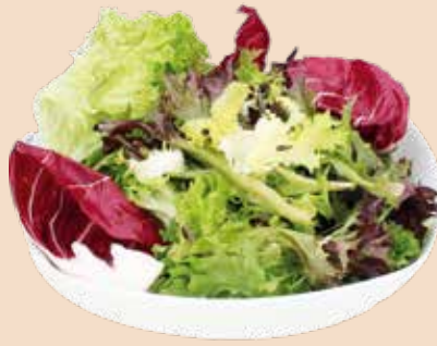
Salatmischung der Saison 1 kg