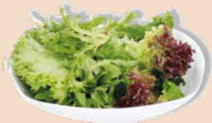
Salatmischung Fire 1 kg